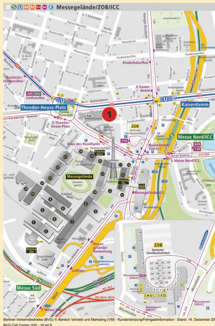
Berliner Verkehrsbetriebe (BVG) © Bereich Vertrieb und Marketing (VM) - Kundenbindung/Fahrgastinformation - Stand: 14. Dezember 2008 BVG Call Center: 030 - 19 44 9